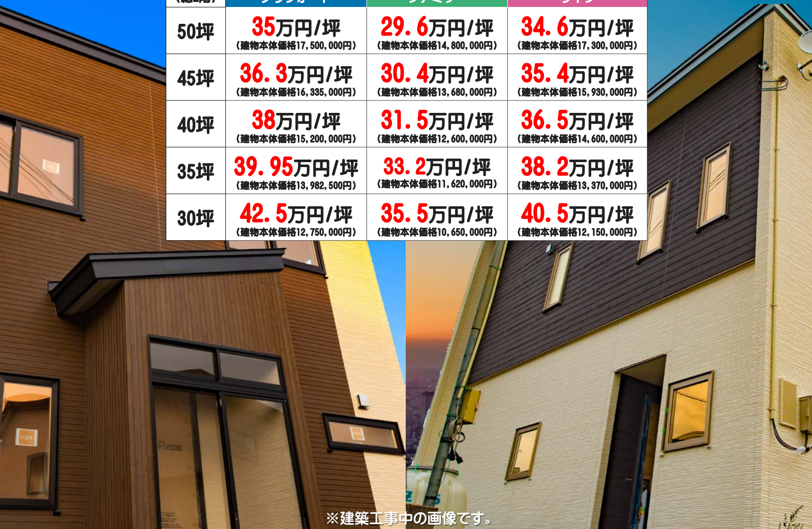
※建築工事中の画像です。